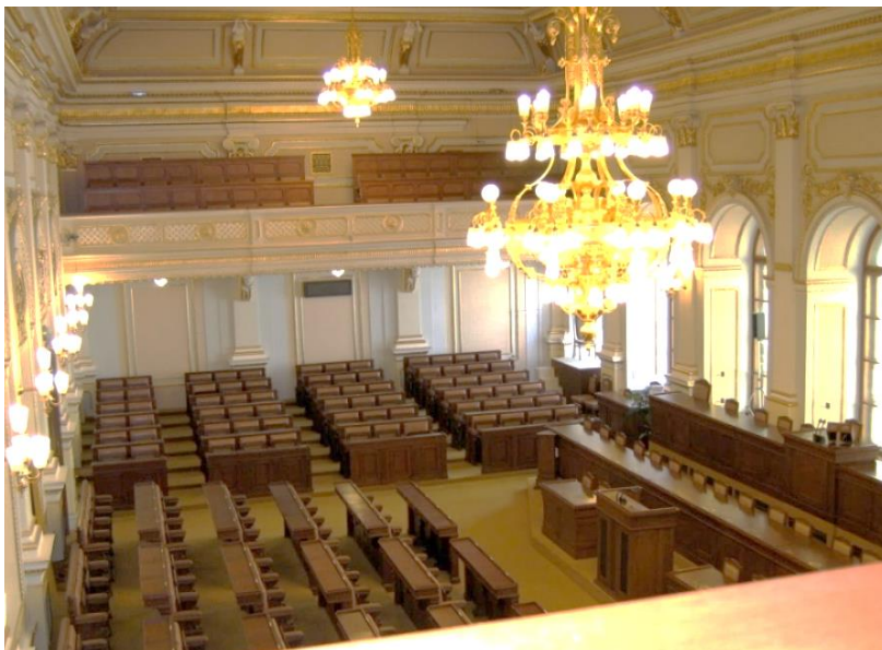
Jednací sál poslanecké sněmovny parlamentu ČR