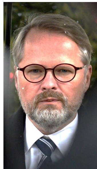
prof. PhDr. Petr Fiala, Ph.D., LL.M. předseda vlády České republiky